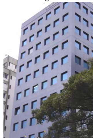
Figura 3 laminado com caixilhos

O quadro 2 apresenta os tipos de vidros mais utilizados encontrados