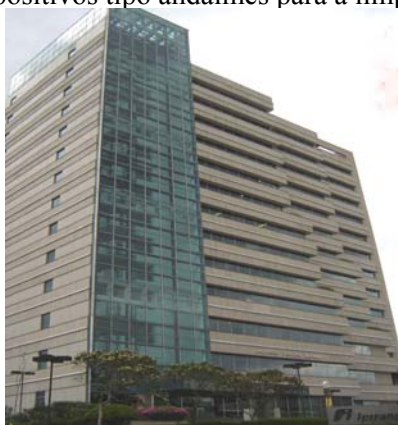
Figura 5 Fachada transparente deslocada da estrutura

Nenhum dos prédios estudados apresentava detalhes construtivos específicos para realizar atividades de manutenção ou que, ao menos, facilitassem a execução das mesmas. Observa-se que nos prédios com pele de vidro a manutenção, uma simples limpeza ou a substituição de um de seus componentes, necessitam de andaimes externos sendo que em dos casos, devido à fachada estar afastada da estrutura (figura 5), haveria a necessidade de um andaime interno, pois a sua forma piramidal na cobertura inviabiliza a colocação de dispositivos tipo andaimes para a limpeza externa.