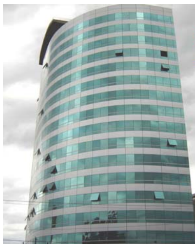
Figura 2 Fachada transparente com chapas de alumínio

Na amostra não aleatória de 15 prédios realizada em Porto Alegre RS, foi possível observar que em prédios comerciais predominam o uso de fachadas de pele de vidro refletivos combinadas ou não com detalhes arquitetônicos em alvenaria e concreto. Em alguns casos, com chapas de alumínio (figura 2). Em prédios residenciais predominou o uso de vidros laminados que entram na composição das fachadas. Nesse caso o vidro laminado é utilizado com caixilhos como mostra a figura 3.