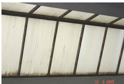
Figura 4 Fechamento com policarbonato alveolar apresentando depósito de sujeira.

Os policarbonatos e acrílicos foram verificados somente em detalhes como, por exemplo: fechamentos de clarabóias, mas os cuidados na execução e manutenção são imprescindíveis para que não ocorram problemas como mostra a figura 4. Na figura percebe-se acúmulo de sujeira na parte inferior da esquadria. Isso pode demonstrar falta de manutenção ou instalação sem os dispositivos adequados para evitar esse problema.